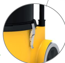
Crochets de fermeture x2